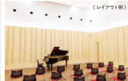
グランドピアノ(ヤマハC7X)あり