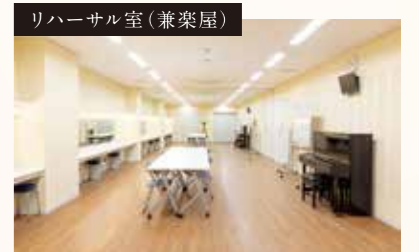
リハーサル室（兼楽屋）