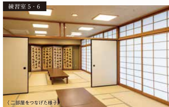
〈二部屋をつなげた様子〉