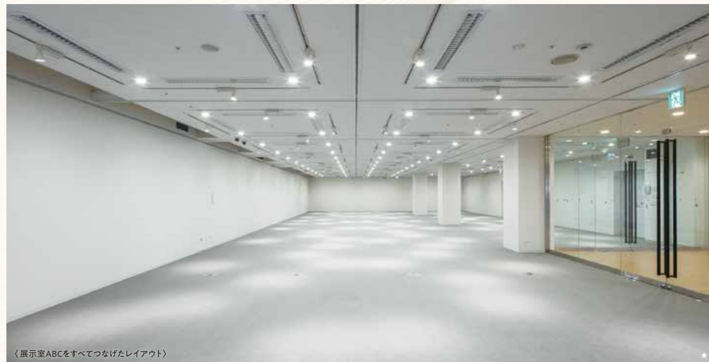
〈展示室ABCをすべてつなげたレイアウト〉

サークルの展示会やセミナー、個展など1室からご利用いただけます。展示パネルを移動して自由なレイアウトが可能です。