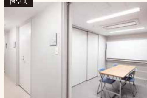
展示室ABCそれぞれに控室があります。