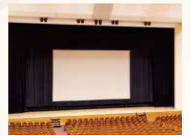
映画用スクリーンあり