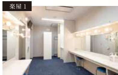
鏡、洗面台、着替えスペース、ロッカーあり