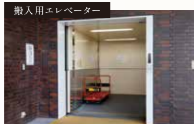
屋外と直結している搬入用エレベーターがあり、スムーズに搬入ができます。

[楽屋1] 定員7人/15㎡ [楽屋2] 定員3人/9㎡ [楽屋3] 定員3人/9㎡ [楽屋4] 定員5人/13㎡