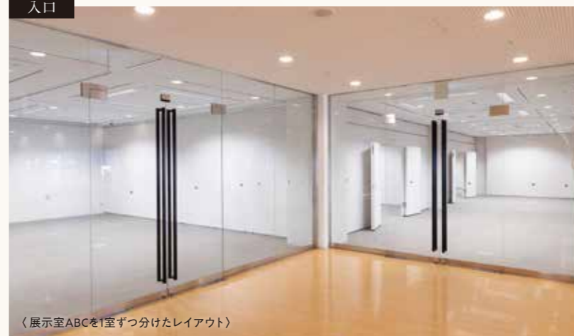
〈展示室ABCを1室ずつ分けたレイアウト〉