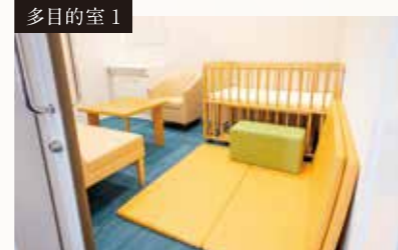
[多目的室1.2] キッズルーム、授乳室、スタッフルーム等様々なご利用が可能です。