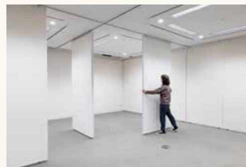
天井のレールに沿ってパネルを動かせます。