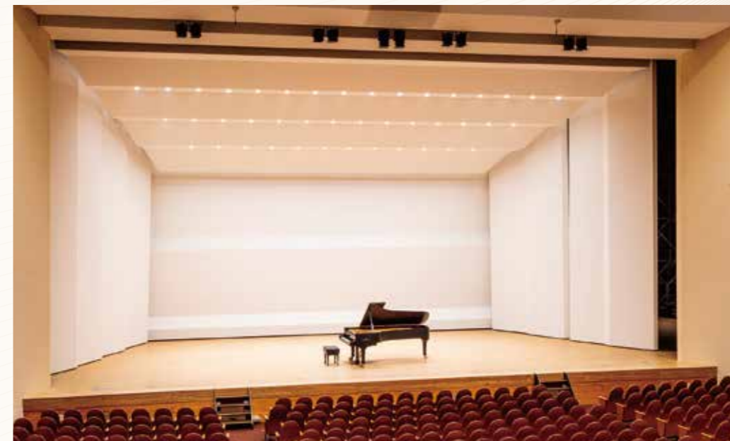
音響反射板、フルコンサートピアノ（スタインウェイD274・ヤマハCF）あり