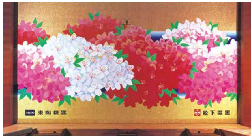
▲小ホール縦帳「市の花ツツジと市の木アカシア」