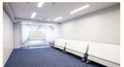
様々なレイアウトでご利用いただけます。