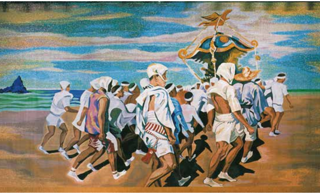
▼大ホール第1縦帳「浜降祭」(原画:小山敬三)