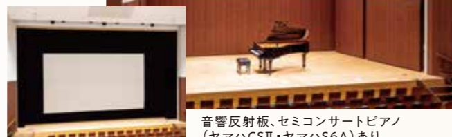
映画用スクリーンあり