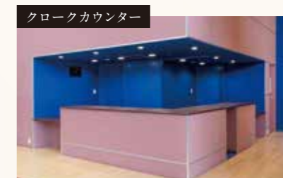
クロックカウンター