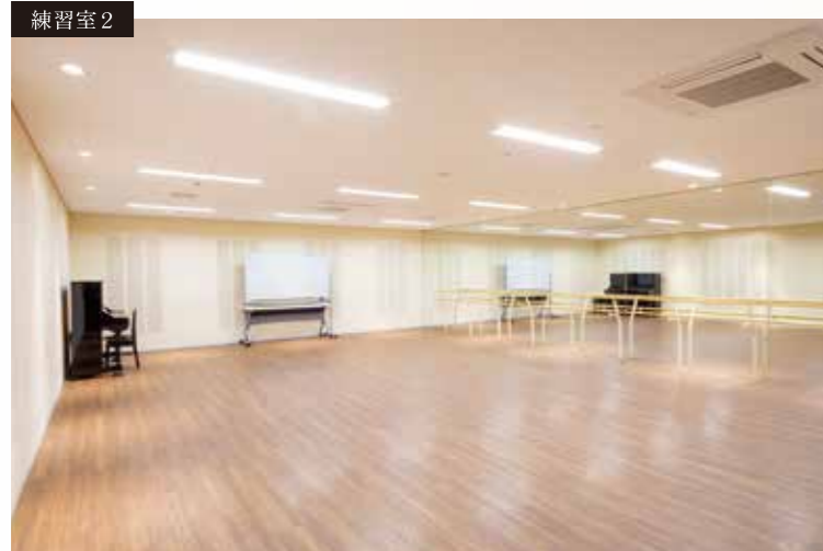
大型鏡、レッスンバー、アップライトピアノあり [面積] 81㎡