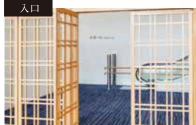
市民ロビーに面したお客様の入場口です。ホワイエ内にエスカレーターもあります。