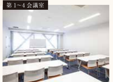
第3・4会議室はパーテーションを開けて一部屋として利用可能です。